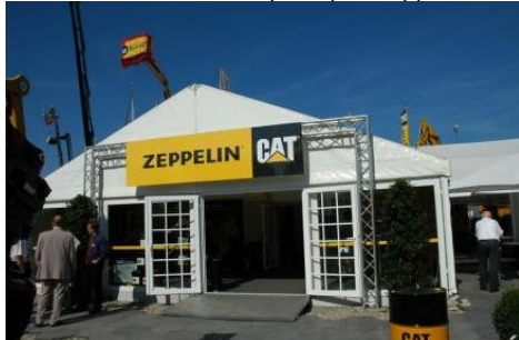
Stand freistehend (Beispiel typenähnlich)